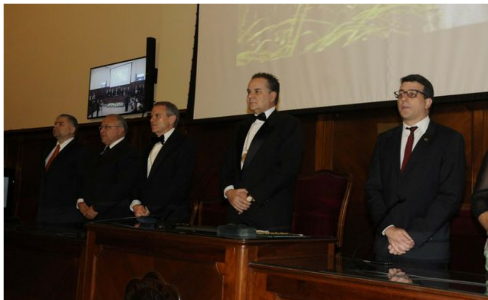
Parte da Mesa Diretora durante a execução do Hino Nacional Brasileiro