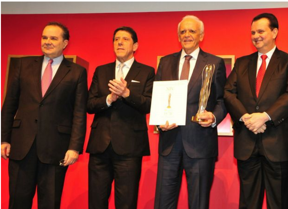
Entrega do prêmio

Rubens Belfort recebendo o prêmio Conrado Wessel na categoria Medicina das mãos de Francisco Sampaio (Presidente da Academia Nacional de Medicina), David Uip (Secretário de Saúde do Estado de São Paulo) e Gilberto Kassab (Ministro de Ciência e Tecnologia e Comunicações).