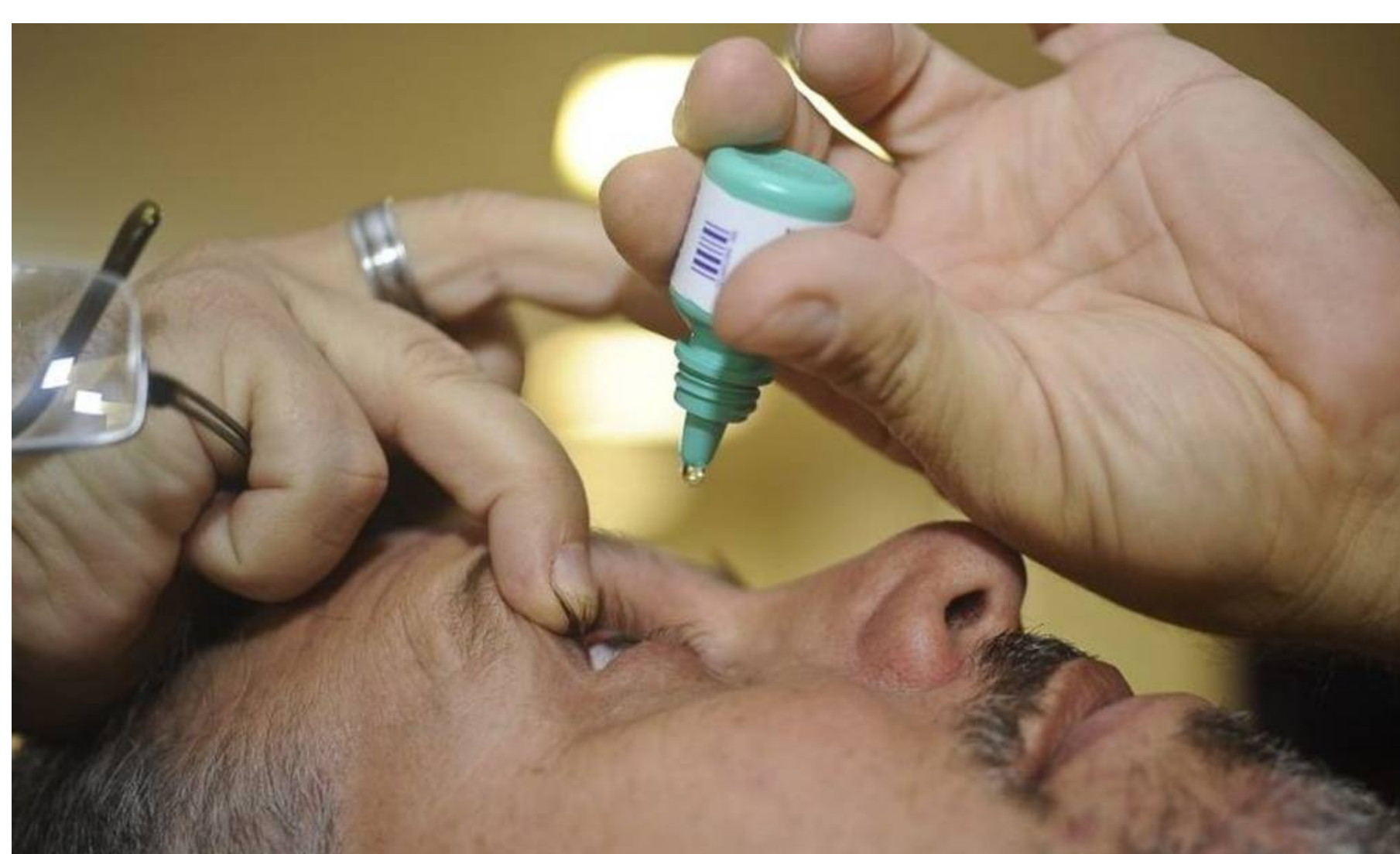
Projeto dá atendimento oftalmológico gratuito às populações do interior do Amazonas